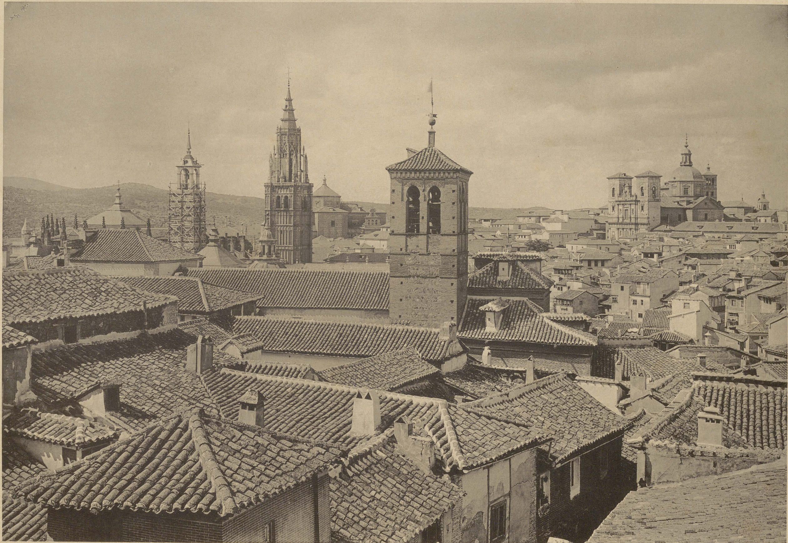
TOLEDO BLICK AUF TOLEDO VOM ALCAZAR

La torre del reloj de la catedral, rodeada de andamios quizá para su demolición, lo fue entre 1888-89