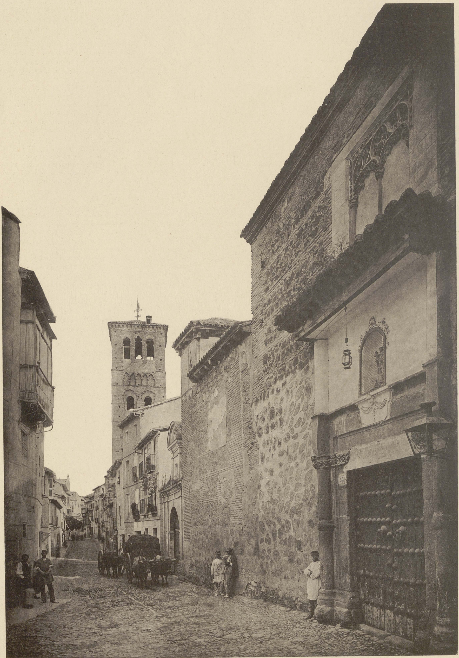
TOLEDO STRASSE MIT DER KIRCHE ST. THOMAS