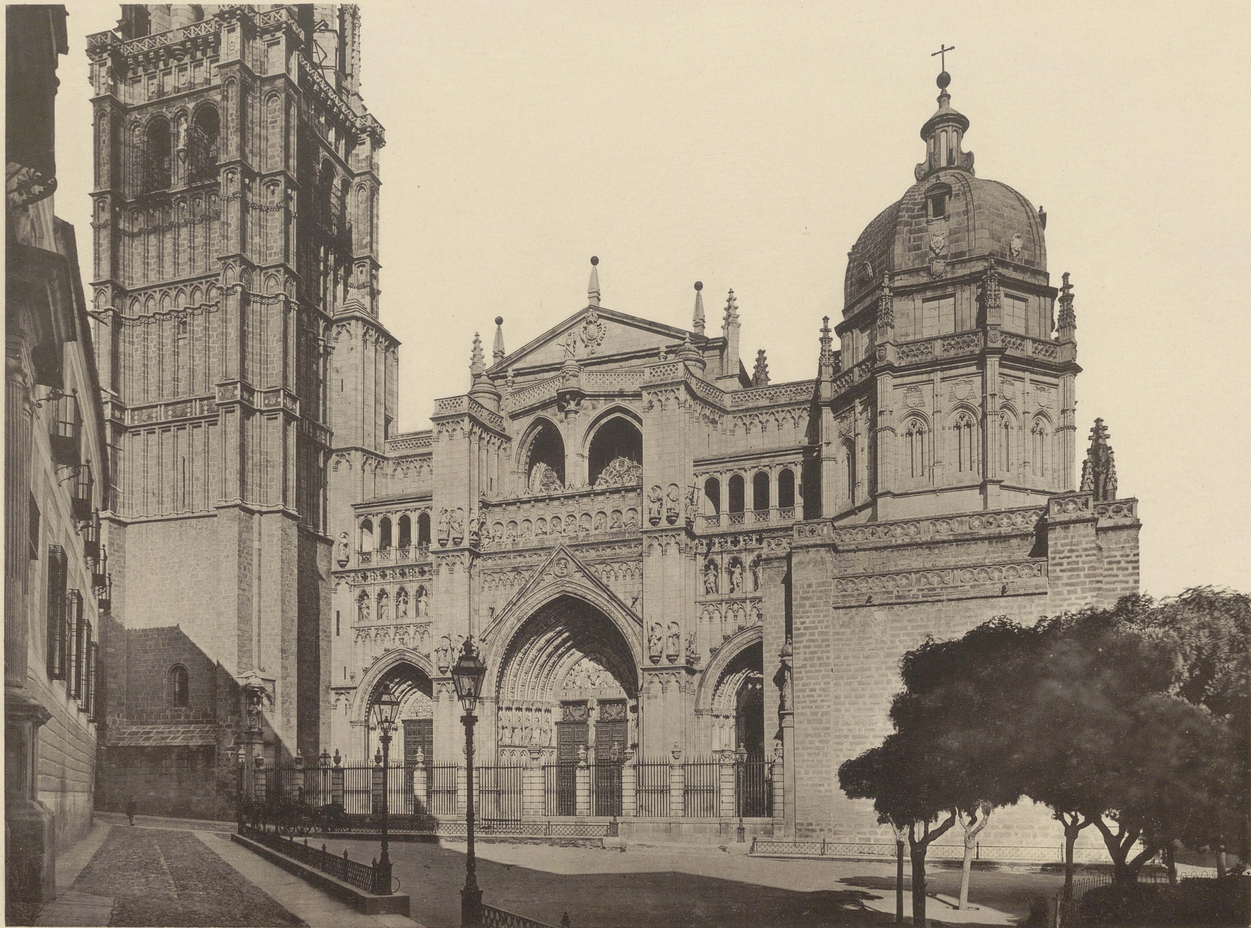
TOLEDO WESTFASSE DER KATHEDRALE